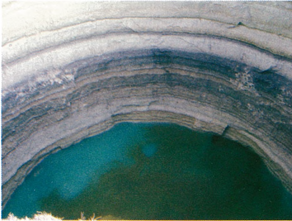
İnoba Obruğu'nun sulu hali

Karapınar Obrukları için cehennem çukurları denilse de, kendi içinde öylesine şaşırtıcı güzellikler barındırırlar ki görenleri hayrete düşürür. Bunlar dünyanın sayılı karstik oluşumlarıdır. Oluşumları milyonlarca yıldan beri süregelmekte olup halen günümüzde de devam etmektedir.